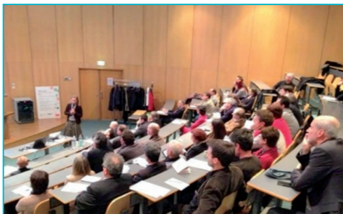
Conférence sur l'économie durable pour les adhérents du CEPR.

Emploi : de nouveaux métiers et également de nouvelles formations verront le jour dans notre région qui va ainsi bénéficier du caractère attractif et innovant de ce projet. Le projet éolien de la baie de St Brieuc contribuera à une meilleure cohésion sociale et territoriale, tout en assurant l'accès à l'énergie propre pour tous.