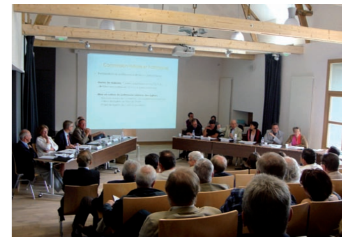
Assemblée générale du Conseil de Développement.

de Développement met en œuvre depuis sa création. Le porteur de projet de parc éolien offshore pourra s'appuyer sur un large consensus et sur une structure habituée et capable de travailler en cherchant le meilleur compromis possible.