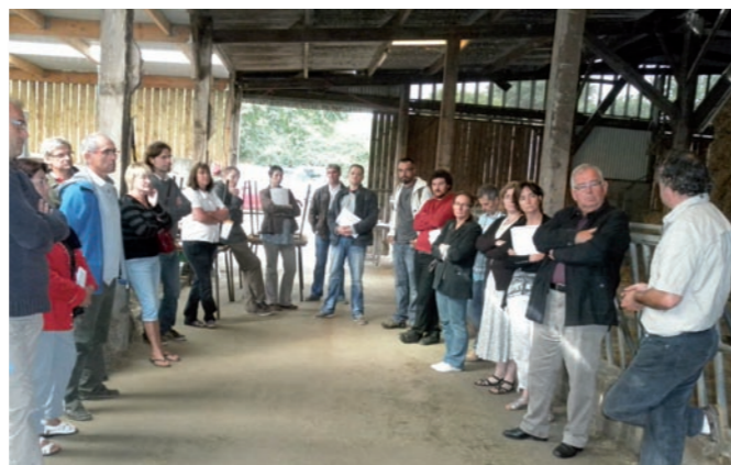
Visite d'une exploitation agricole dans le cadre de la mise en place d'une filière « Circuits courts » par le Conseil de Développement.

Nous considérons donc que – selon le principe du « donnant-donnant », le territoire du Pays de Dinan bénéficie de tous les atouts – et est enthousiaste ! – pour accueillir la base de maintenance à Saint-Cast-Le-Guildo et travailler en concertation et en réseau avec le consortium Ailes Marines, de manière à faire en sorte que cette nouvelle infrastructure puisse être actionnée comme un levier de développement pour un territoire qui en a grand besoin.