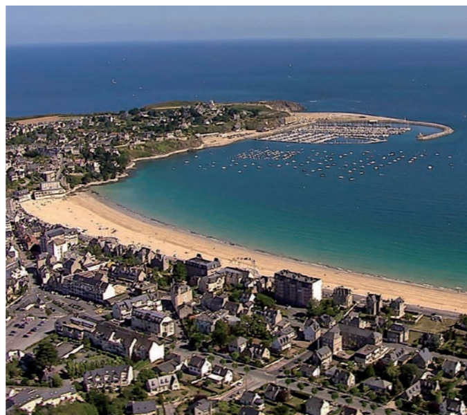
Vue aérienne de Saint-Cast Port d'Armor

L'ambition de la ville et de ses partenaires est de redonner de l'élan à un territoire côtier qui ne demande qu'à être valorisé. La base de maintenance à Saint-Cast-Le-Guildo constitue un moyen d' inverser la tendance économique et démographique de ce territoire.