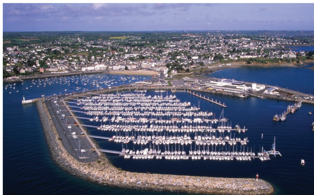
Port de Saint quay portrieux.

1070 places à flots sur 10 pontons, l'espace dédié à la plaisance pourra garder tout le confort moderne tout en continuant à se développer.