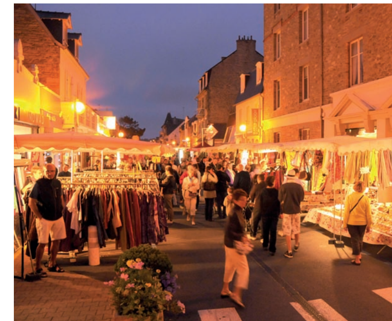
Marché nocturne organisé par l'UCAC à Saint-Cast-Le-Guildo

Nous attendons donc de ce choix des perspectives