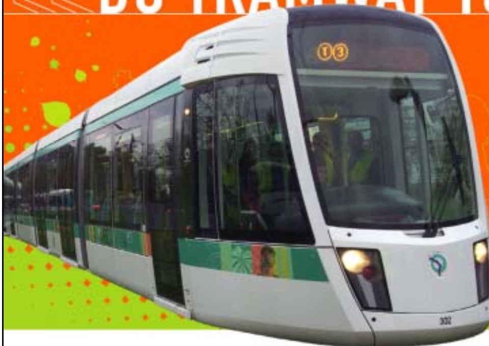
TABLE-RONDE 23 mars 2006 Mobilité réduite et déplacements