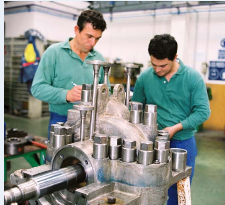
Travaux dans les ateliers de maintenance