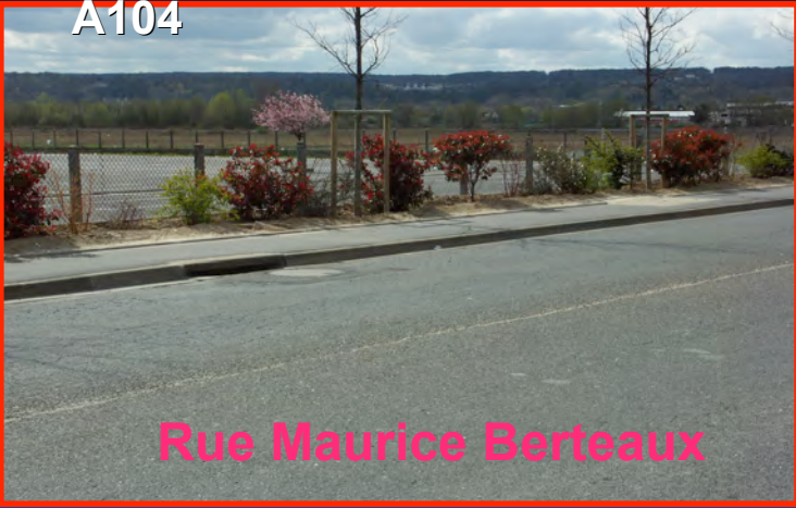
Rue Maurice Berteaux

Parking Leclerc coupé par le projet A104