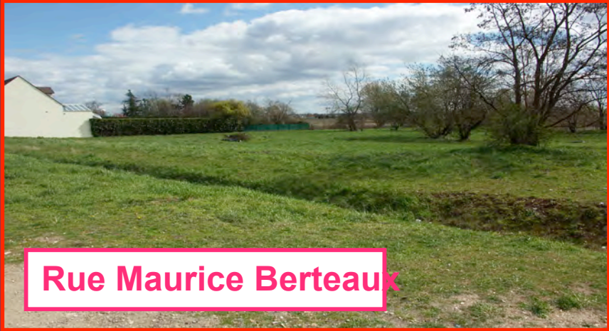
Rue Maurice Berteaux