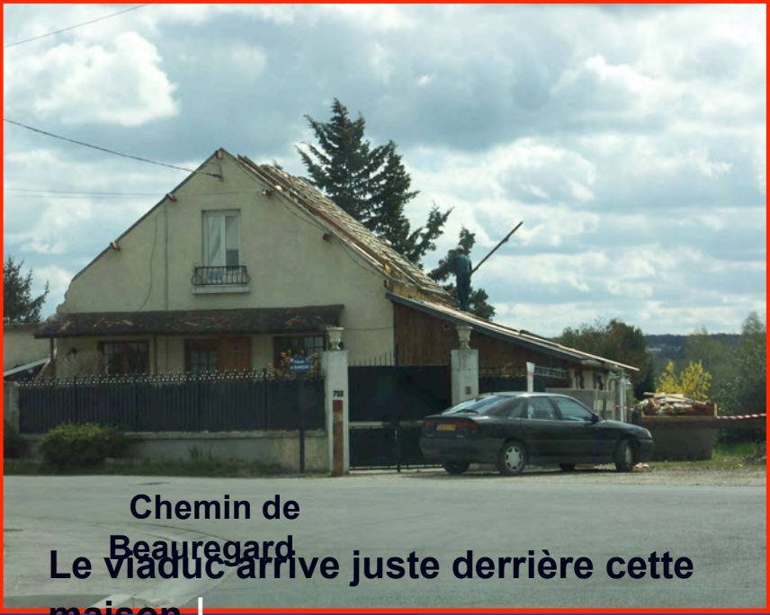
Chemin de Beauregard Le viaduc arrive juste derrière cette maison |