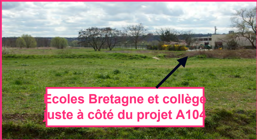
Ecoles Bretagne et collège juste à côté du projet A104