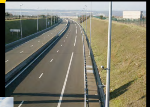
Exemple de déblai