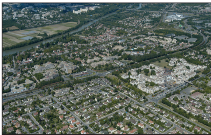
Éragny traversé par la RN 184.