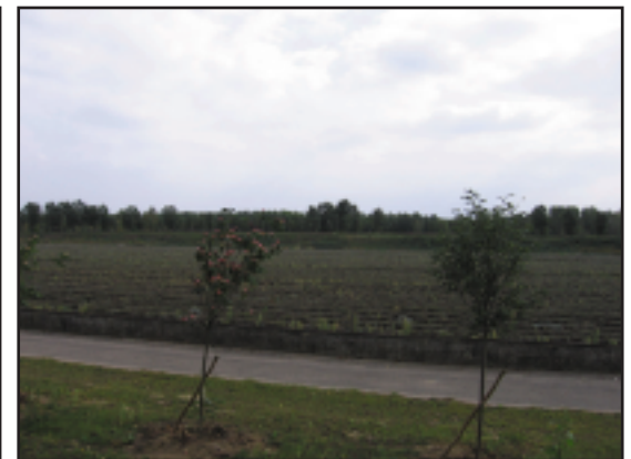
Parc agricole d'Achères.