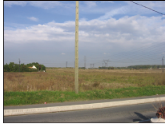
Plaine de Pierrelaye.