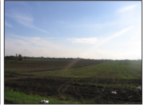
Espace ouvert entre Conflans-Sainte-Honorine et Herblay.