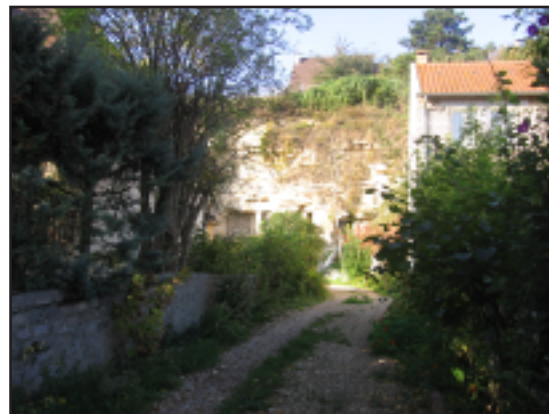
Cave troglodyte de Gaillon.