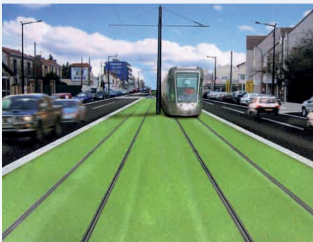
Insertion du tramway sur la RD7

Aucune réflexion sur les transports à l'échelle métropolitaine ne peut se faire sans que ne soit pris en compte le caractère vétuste, inadapté et saturé des lignes RER qui pénalise tout particulièrement les habitants et les salariés de la grande couronne. La rénovation et un vaste plan de rattrapage des RER constituent une priorité absolue pour les quelque 3 millions de Franciliens usagers quotidiens de ces trains. Les RER C et D font également état d'irrégularités persistantes et de défaillances régulières du fait notamment de la hausse de fréquentation (4 à 5 % par an). La gare de Juvisy-sur-Orge représente à ce titre un élément central du maillage ferroviaire nord-sud et sud-nord avec plus de 55 000 visiteurs par jour répartis entre les lignes C et D. C'est pourquoi, il est nécessaire que le « Plan de mobilisation pour les transports » soit complété sans attendre par un Plan de rattrapage et de modernisation des lignes RER C et D. Celui-ci doit confirmer les intentions du STIF et comprendre le sextuplement des voies entre la gare de Juvisy et celle de la Bibliothèque François Mitterrand.