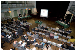
Réunion des Conseils consultatifs de quartier à Suresnes - 8 novembre 2010