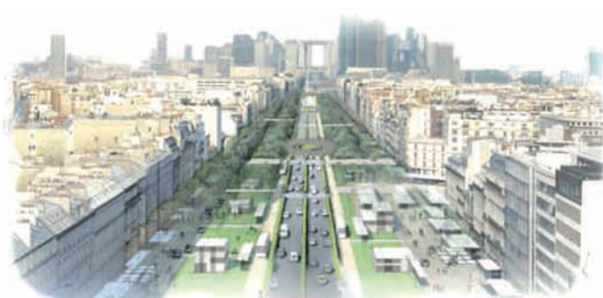
Exemple d'aménagement de l'avenue Charles de Gaulle de Neuilly en boulevard urbain.

Faire de l'axe majeur un grand projet d'urbanisme est l'affaire de tous ceux qui partagent l'idée que ce territoire ne doit pas être traité comme un projet routier mais comme une formidable ambition qui concilie la qualité des lieux de vie et la compétitivité du Grand Paris (villes, riverains, architectes, urbanistes, historiens, entreprises etc.).