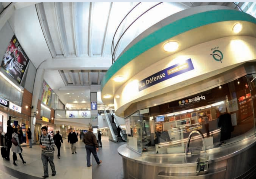
Le hub de La Défense

De nouveaux services y seront développés pour les habitants et les usagers en complémentarité avec ceux déjà proposés par le tissu de commerçants et d'artisans de proximité.