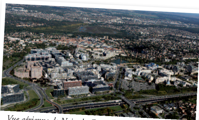
Vue aérienne de Noisy-le-Grand.

C'est la raison pour laquelle la Ville de Noisy-le-Grand soutient les deux projets de réseaux.