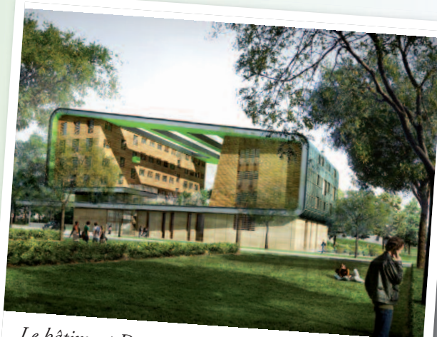
Le bâtiment Descartes + (projet Atelier T. Roche et associés) qui devrait voir le jour en 2012 accueillera 1 200 étudiants et chercheurs.

Ce projet doit être une opportunité pour le développement de Noisy-le-Grand, dont les projets ambitieux en termes de développement économique, de renouvellement urbain, de créations de logements s'inscrivent parfaitement dans l'objectif global de développement de l'Est parisien.