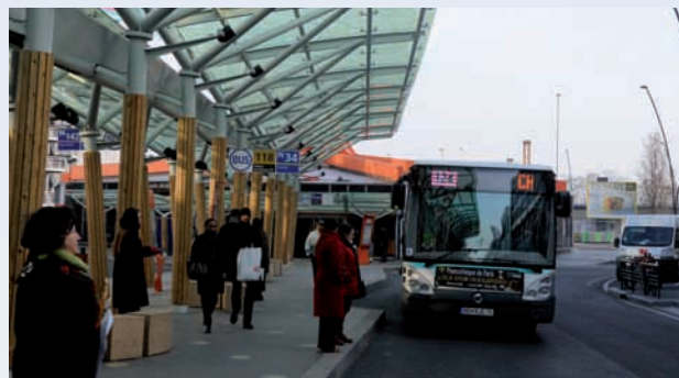
45 000 voyageurs par jour à la gare multimodale de Val de Fontenay

Un maillage du réseau de transports en banlieue est utile et performant que s'il est connecté aux réseaux existants.