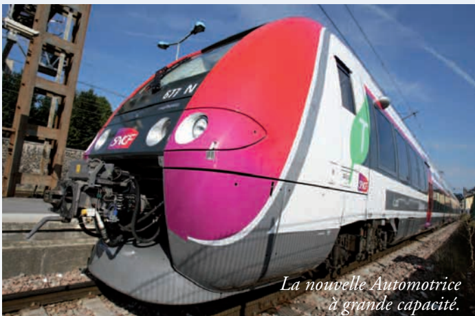
La nouvelle Automotrice à grande capacité.

Cela implique qu'une attention particulière soit portée aux