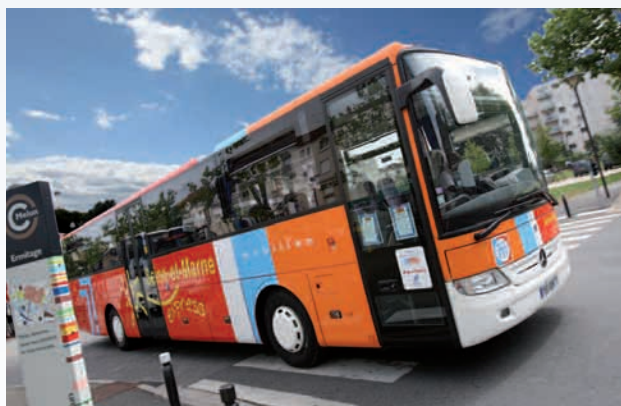
Le réseau de bus Seine-et-Marne Express

Il est donc urgent d'assurer la mise en œuvre du Plan de mobilisation adopté en 2009 par la Région et l'ensemble des départements franciliens et qui porte sur un investis-