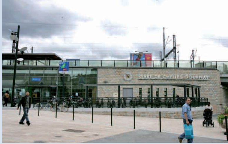
La gare de Chelles

interconnexions avec les réseaux existants, Transilien, TER et RER.