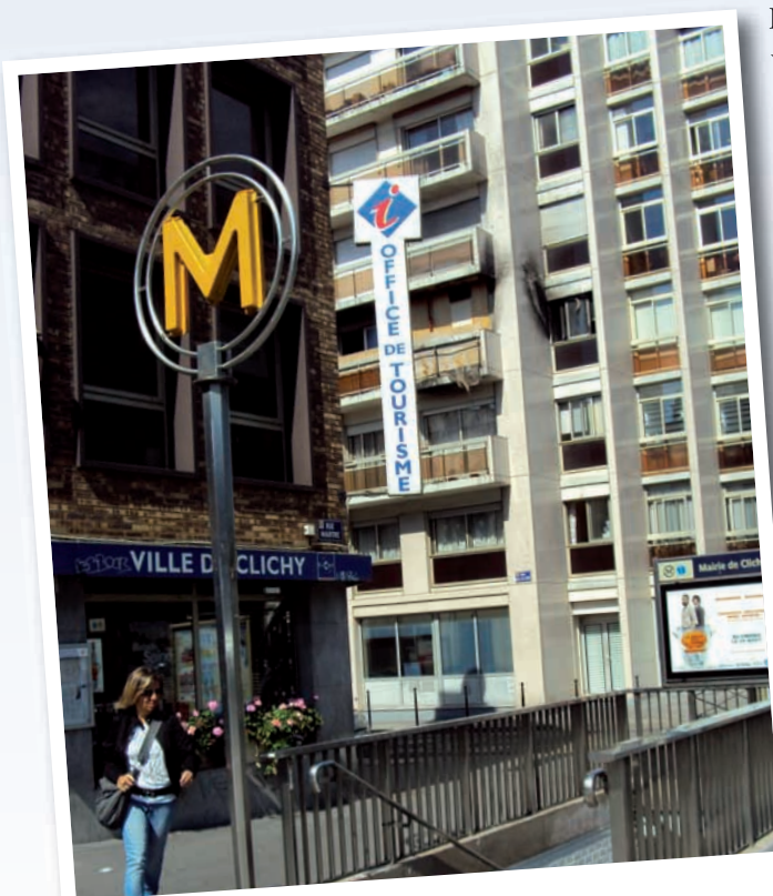
Station de métro Mairie de Clichy

La station de métro Mairie de Clichy est la seule desservant le territoire de Clichy, c'est-à-dire 59 000 habitants, alors que les 17 e et 18 e arrondissements de Paris bénéficient d'une station pour 10 000 habitants. Cet écart significatif est aggravé par les problèmes de saturation affectant la ligne 13 , d'ailleurs bien connus : une situation intenable aux heures de pointe avec une densité pouvant atteindre 4,5 personnes/m 2 , des conditions de transport très inconfortables, de nombreux incidents techniques et des risques en termes de sécurité.