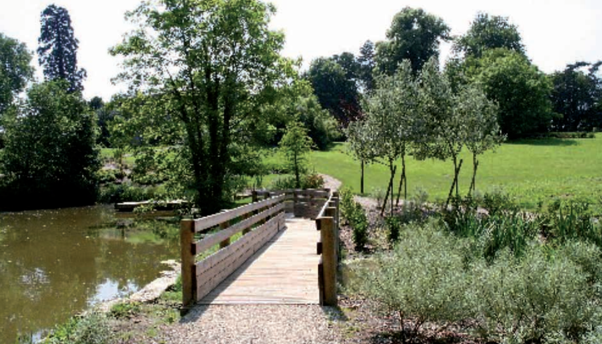
Parc de la Corbie

de Dammartin-en-Goële demande que soit finalisé le bouclage de la A104.