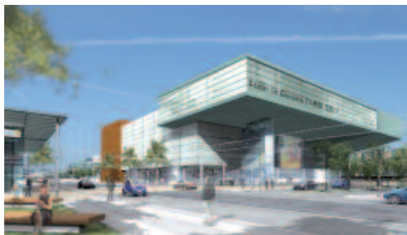
Projet de centre des congrès de Paris-Orly