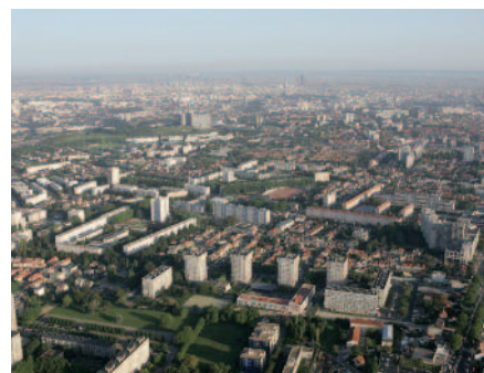
Un métro qui doit desservir les quartiers d'habitat collectif.

la ligne 7 du métro. Cet investissement est complémentaire de ceux prévus par le Plan de Mobilisation Régional pour les transports en Île-de-France et de la nécessité d'améliorer le réseau existant.