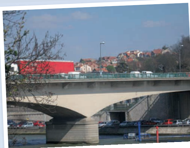
Pont de Villeneuve enjambant la Seine

D'une part, il faut donner à la ligne de nouvelles marges de manœuvre en affectant 4 ou 5 rames supplémentaires au RER D et éviter ainsi les suppressions de train pour cause de maintenance.