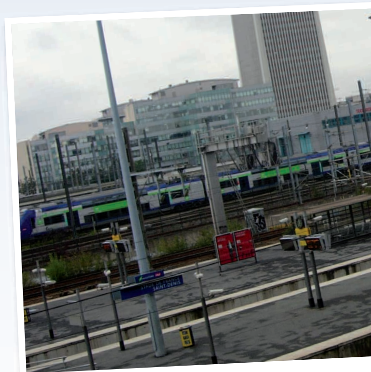
Secteur Landy Pleyel. Gare du RER D Stade de France - Saint-Denis