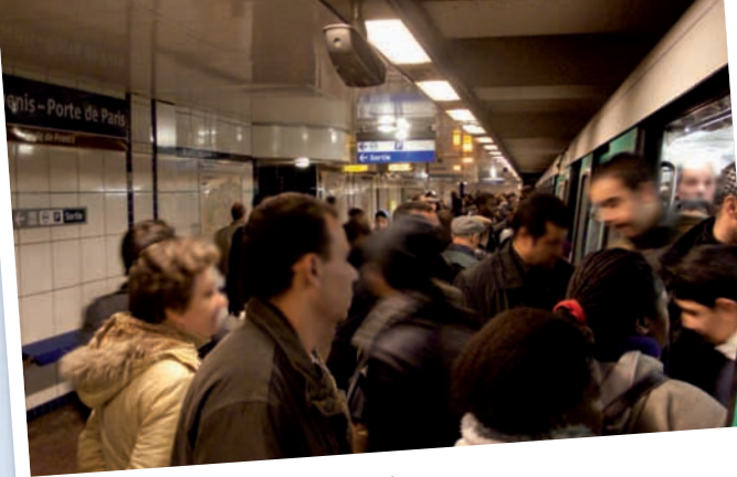
La ligne 13, largement saturée