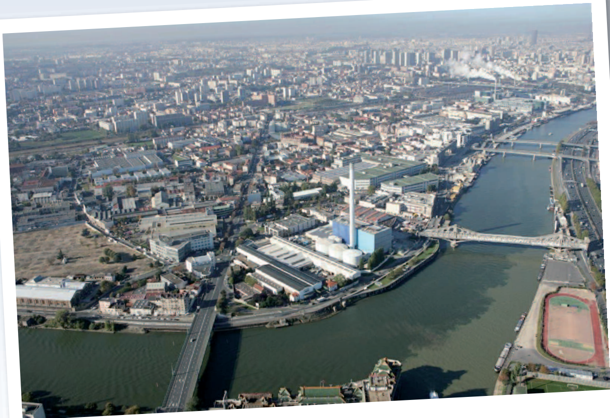
Vue d'Ivry-sur-Seine depuis Alfortville.