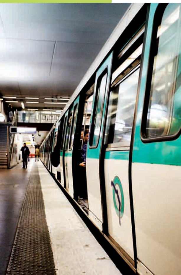
La station de métro au Kremlin-Bicêtre

Le Kremlin-Bicêtre est aussi marqué par un tissu urbain varié, entre la partie nord, le long de la RD7, compacte et minérale, et, au-delà du fort et de l'hôpital, dans la partie haute de la ville, au sud, une alternance de résidences d'habitat social et de secteurs pavillonnaires, plus aérée et plus verte. C'est sur cette dernière que la municipalité a conduit depuis plusieurs années d'importants efforts de rééquilibrage, améliorant l'offre de service public, de réhabilitation des logements sociaux, de requalification des espaces publics. C'est aussi là que se joue, à terme, le développement de la ville.