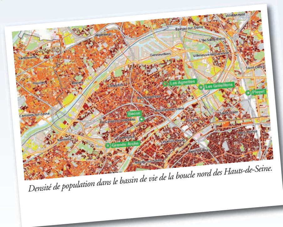
Densité de population dans le bassin de vie de la boucle nord des Hauts-de-Seine.