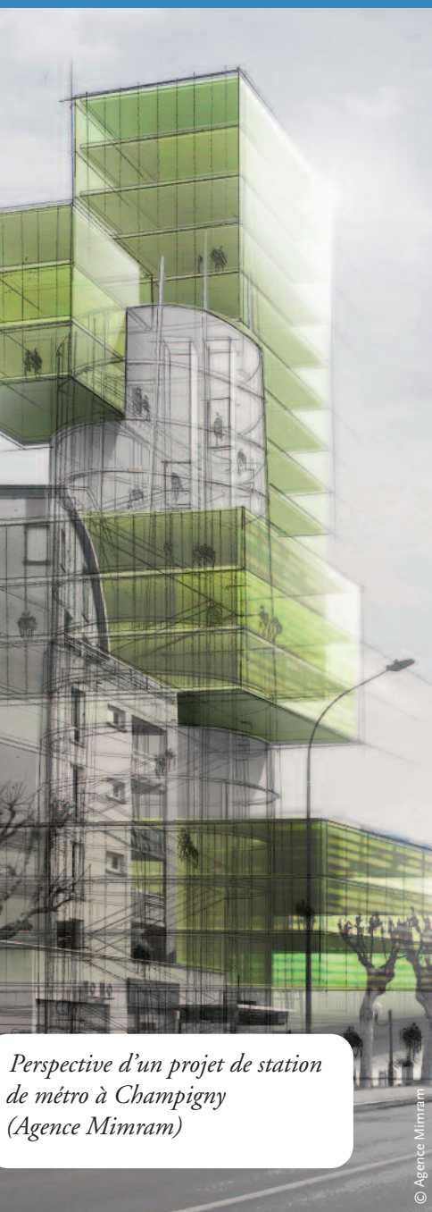
Perspective d'un projet de station de métro à Champigny (Agence Mimram)

Si on ne veut pas mettre en concurrence les territoires, les 2 projets de métro proposés par la Région et l'Etat ne doivent pas s'opposer mais s'additionner.