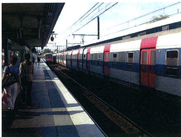
Gare RER (Paris Métropole, septembre 2010)

La tarification doit faire partie intégrante de la conception du réseau futur et participer d'une nouvelle stratégie multimodale de services de transport, encourageant l'utilisation des transports en commun.