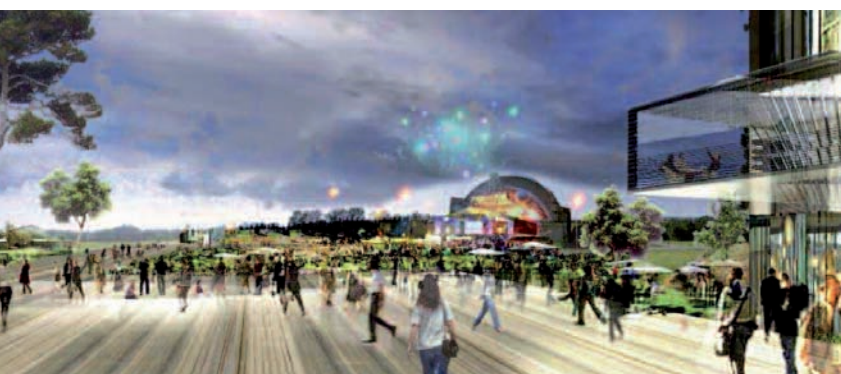
L'Aire des Vents vue par Roland Castro.

Il a confirmé l'énorme potentiel métropolitain des communes du pôle du Bourget et a fait émerger sept grandes lignes de force pour le projet de territoire :