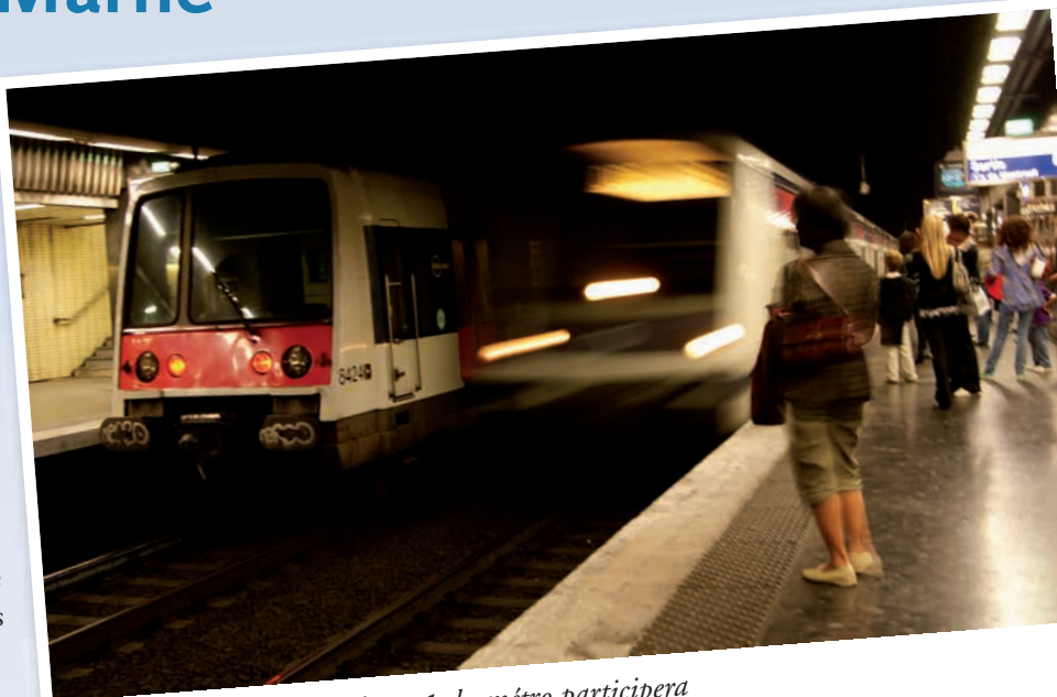
Le prolongement de la ligne 1 du métro participera à désaturer la ligne A du RER.

Ces lignes constituent autant de possibilités de correspondances pour le futur métro de rocade. Une connexion à Val de Fontenay améliorera l'efficacité globale du réseau de transport dans l'Est parisien.