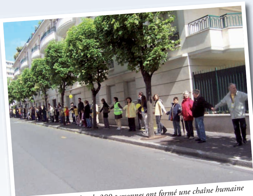
Le 20 mai 2006, plus de 300 personnes ont formé une chaîne humaine sur le tracé du prolongement en présence de nombreux élus locaux.

d'exemple, en quatre mois seulement, plus de 3 200 personnes ont signé la première pétition lancée en mars 2006. Ce véritable engouement témoigne du vif intérêt des habitants et des acteurs socio-économiques du nord du Val-de-Marne pour la réalisation de ce projet.