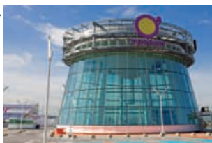
PSA Peugeot Citroën