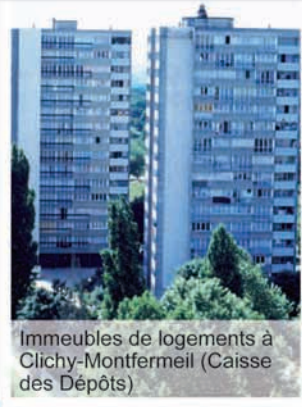
Immeubles de logements à Clichy-Montfermeil (Caisse des Dépôts)