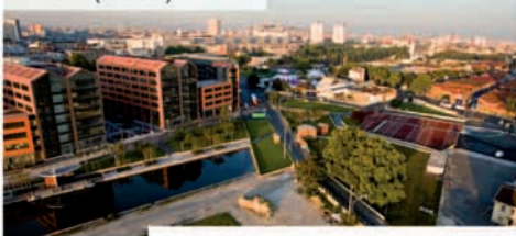
Le site du Millénaire - EMGP (Icade)