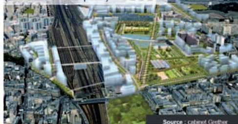
Le projet de Clichy-Batignolles (Caisse des Dépôts)