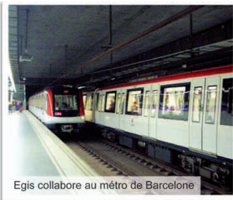
Egis collabore au métro de Barcelone

L'Emprunt National entre dans sa phase opérationnelle. La Caisse des Dépôts s'est vue confier la gestion pour le compte de l'État de 7 milliards d'euros, à travers 8 thématiques, dont le fonds national d'amorçage, « France-Brevets », les plates-formes d'innovation des pôles de compétitivité, le programme « Ville de demain » et le développement de l'économie numérique.