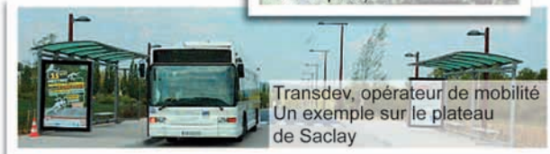
Transdev, opérateur de mobilité. Un exemple sur le plateau de Saclay