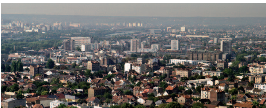
8 km de façade sur la Seine, à 10 km du cœur de Paris et à 5 km de La Défense

Une offre d'habitat et d'emplois qui doit bénéficier de connexions renforcées avec le cœur d'agglomération