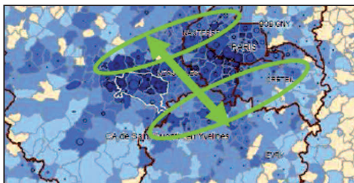
Bassin d'habitation des salariés venant travailler sur le secteur de Pissaloup-Clef Saint Pierre (données PDIE 2009).

La cartographie des domiciles des salariés de la zone montre un étalement beaucoup plus large sur un grand nombre de communes actuellement peu desservies par l'axe de communication radial Paris – Versailles – Saint-Quentin. La jonction avec un axe de transports en commun Nord Sud permettrait de drainer une population de l'ordre de 10 à 15 % des salariés sur cet axe dans le futur, doublant potentiellement la proportion d'utilisateurs des TC (développer).