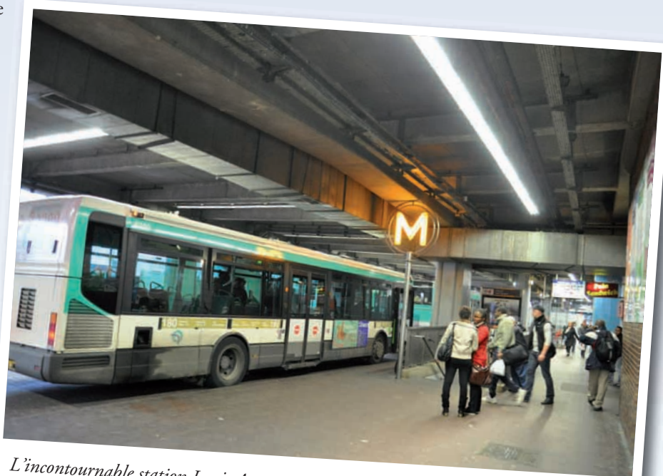
L'incontournable station Louis Aragon en connexion avec la ligne 7, le futur tramway et la gare routière.

Notre volonté de transformer cet axe en véritable boulevard urbain sous l'impulsion du Conseil général, permettra d'améliorer et d'embellir le cadre de vie des habitants, de favoriser les circulations douces et de partager équitablement l'espace entre les différents usagers.