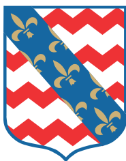
Mairie de Roissy-en-France

Bénéficiant d'une situation stratégique, la commune de Roissy-en-France est aujourd'hui le théâtre de projets de grande ampleur au rayonnement international. Ce développement s'accompagne néanmoins de difficultés croissantes voire de saturation du réseau en termes de déplacements. C'est sur la base de ce constat et des actions menées depuis quelques années que la commune entend contribuer au débat pour améliorer la prise en compte des enjeux locaux au-delà de la création d'un réseau de transport performant devenue aujourd'hui indispensable.