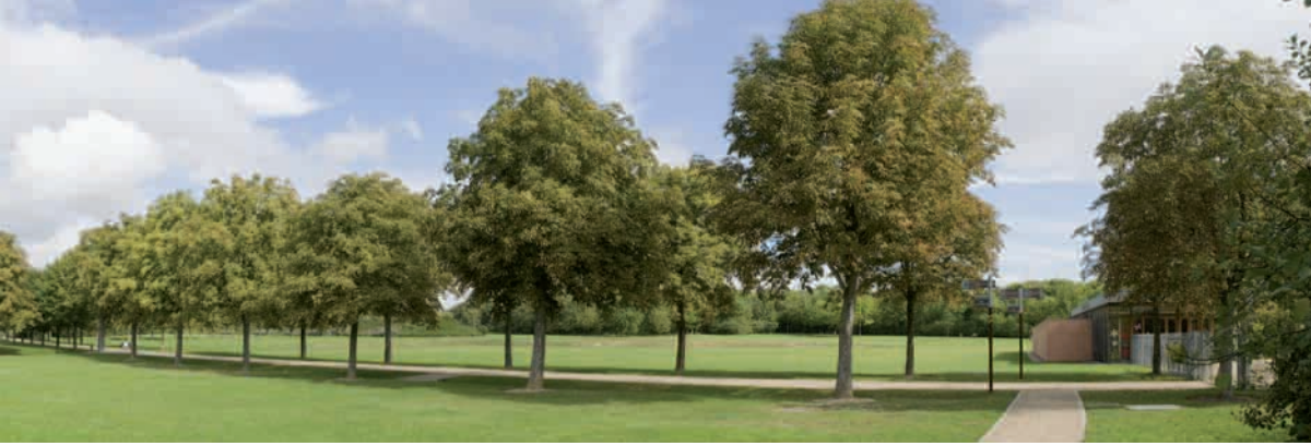
Parc du Sausset