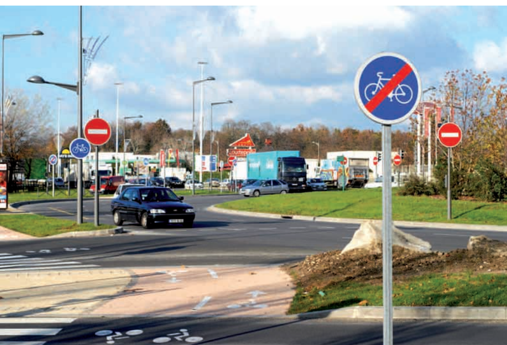
Rond point de l'Europe

Avec des impératifs de développement durable intégrés dans une démarche municipale d'agenda 21, c'est toute une approche environnementale qui guide l'action de la ville. La nouvelle gare implantée le long de la RN2 participera à l'aménagement d'un espace public plus doux, plus harmonieux, où le végétal prendra toute sa place. Cet axe doit faciliter l'accès aux parcs de notre ville comme le Sausset ou Ballanger mais aussi le parc de la Poudrerie ou encore la forêt de Bondy, pour constituer ainsi une véritable trame verte traversant le nord-est parisien.