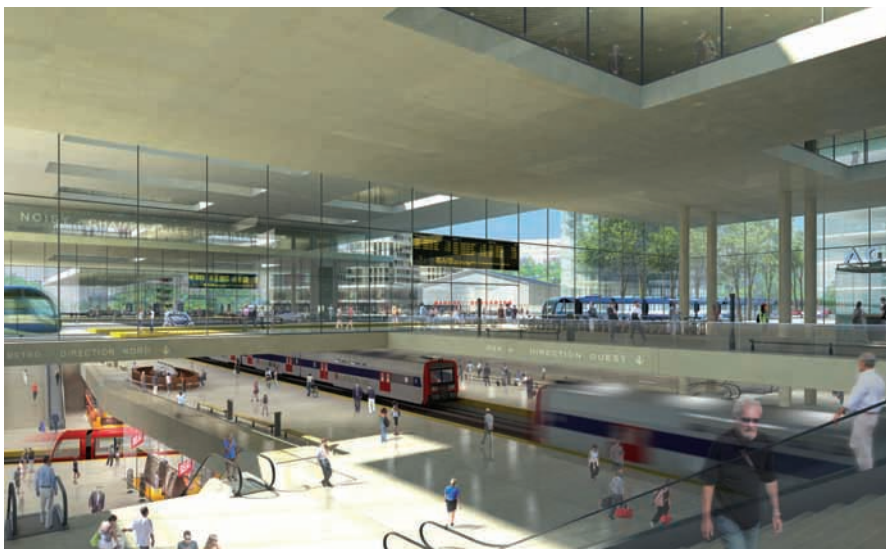
Projet gare multimodale Noisy Champs

Pour le Val de la Marne, la perspective d'une nouvelle ligne de métro/RER en rocade autour de Paris permettra de soulager les dessertes existantes et viendra en appui des grands projets en cours d'élaboration notamment celui du cluster dédié à la ville durable dont le cœur est la cité Descartes à Champs-sur-Marne.