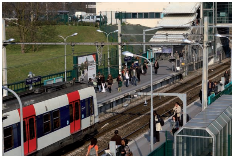
Gare RER de Noisy Champs

Les nombreux mouvements d'actifs entre le Val de la Marne et la petite couronne ou des territoires comme Meaux, Melun, Roissy, Chelles... se font en voiture car les liaisons en transports collectifs sont soit inexistantes soit peu performantes.