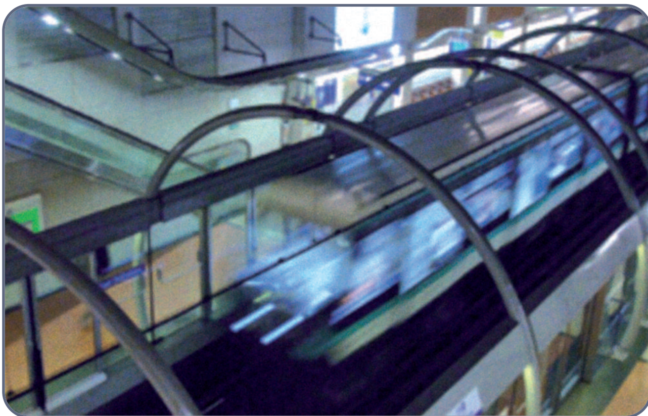
Source : LE DOSSIER DU MAÎTRE D'OUVRAGE /// Caractéristiques principales du réseau de transport/Réseau de transport public du Grand Paris.

Cependant deux aspects doivent être davantage étudiés, l'implantation d'une gare au Petit Nanterre et la réalisation d'un tracé souterrain pour respecter l'environnement des populations.