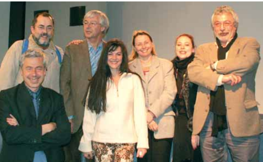
> Les membres de la Commission particulière du débat public.

Il a participé à l'équipe des cinq experts mandatés par les ministres de l'Environnement et des Transports pour organiser et conduire le débat public sur le projet du canal Rhin-Rhône, en 1996, et a suivi pour la CNDP le débat public recommandé CEDRA (CEA, Cadarache – 2001) et la concertation recommandée sur le projet de réacteur de fission nucléaire expérimental Jules Horowitz (CEA, Cadarache – 2005).