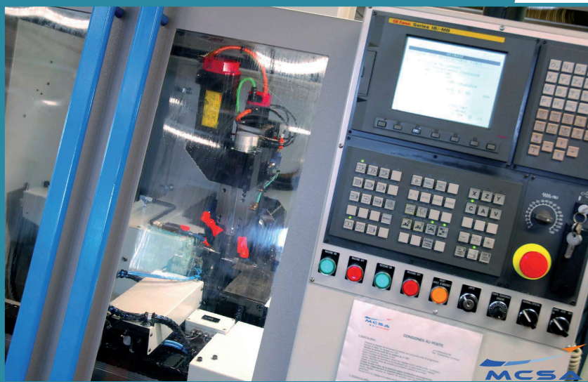
Usine MCSA.