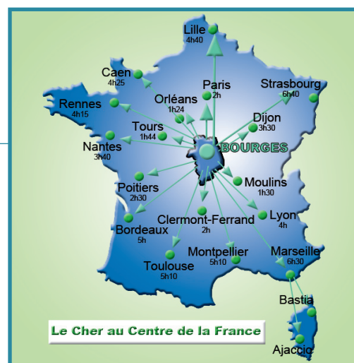
Le Cher au Centre de la France.

L'interconnexion des réseaux de lignes à grande vitesse avec les lignes régionales est à la fois un enjeu d'efficacité et une garantie d'un acheminement rapide et aisé des personnes quel que soit leur lieu de résidence, de travail ou de rendez-vous en Europe. Le développement économique ne peut se concevoir sans une dimension européenne. Le TGV facilite cette liaison vers l'est en intégrant le fait qu'un réseau principal sans interconnexion annexe et qu'elle qu'en soit l'échelle (départementale, régionale, nationale, européenne) n'aura pas de sens sinon de concentrer les populations autour de Hubs.