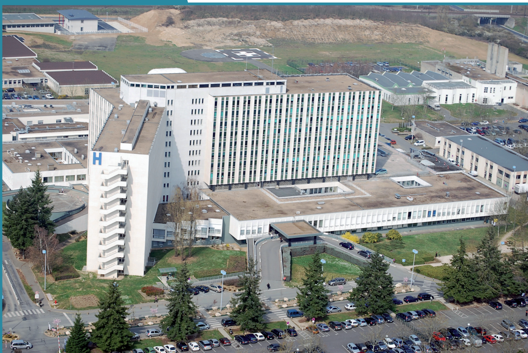
Le centre hospitalier de Blois