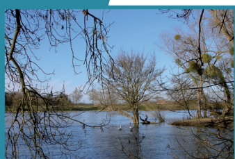
Courpain - St-Mesmin (45)

La Sologne est la zone Natura 2000 la plus étendue de France avec près de 350.000 ha répartis sur 96 communes du Cher, du Loir-et-Cher et du Loiret qui ont chacune pris une délibération. Après délibérations de l'ensemble des communes et plusieurs années de concertations, le périmètre est défini en accord avec les acteurs locaux. Les enjeux de préservation de la biodiversité de cette zone Sologne sont essentiellement liés à la conservation de la mosaïque créée par les milieux "ouverts" (landes, pelouses et prairies), les milieux humides (tourbières, étangs, marais) et les milieux forestiers. Cette mosaïque permet l'existence d'une faune et d'une flore à la fois spécifiques et rares.