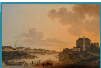
Port d'Orléans (45)

constitue un enjeu majeur du développement de la région, qui recense près de 300 sites naturels inscrits et classés qui vont des plaines de Beauce à la forêt d'Orléans, des étangs de Sologne aux vallées de la Loire et du Cher.