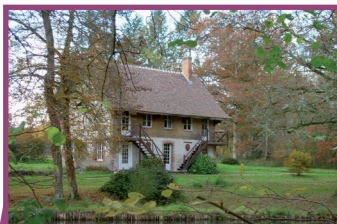
Chalet - Cosson

d'études très poussées de la part des documentalistes du Ministère de la Culture et de la Communication, en collaboration avec le tissu associatif régional et les élus municipaux . Le tracé médian respecte au mieux ces atouts et le travail mené depuis longtemps par les forces vives des territoires ruraux.