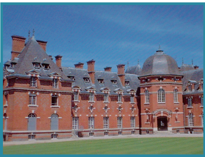
Rivaulde - Sauldre (41)