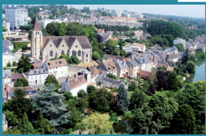
Vierzon centre