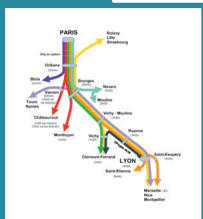
Schéma de desserte de scénario Ouest-Sud