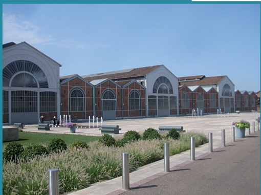
La société française