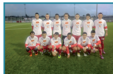
Vierzon Foot (CFA2) se mobilise

Riche d'un patrimoine historique, naturel et industriel, Vierzon, ville des arts du feu et de la céramique, s'est forgée une solide renommée de savoir-faire et de créativité autour de ses grands capitaines d'industrie, puis dans le dynamisme de son tissu de PME/PMI, à la pointe de secteurs technologiques hautement spécialisés, comme la fabrication de roulements à aiguilles ou de matériel oléohydraulique.