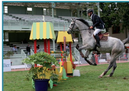
la filière équine

que notre territoire est trop isolé, mal desservi, loin de la capitale ou de Lyon. Le Pays Vichy-Auvergne sert de territoire d'expérimentation dans l'Allier en matière de politique d'accueil et l'arrivée d'une gare nouvelle sur le territoire pourrait transformer cet essai pour créer une véritable dynamique.