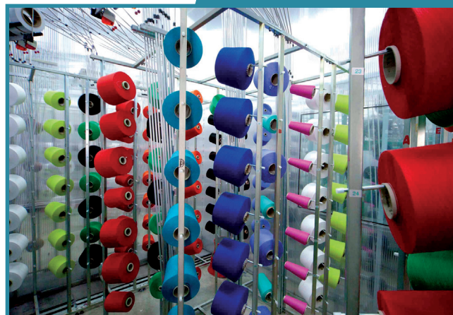
Cantres sur métier rayeur - Bel Maille

Maison des Professions 11 Place des Minimés 42334 ROANNE CEDEX Tél : 04 77 44 54 40 Fax : 04 77 70 16 88 textile-roanne@wanadoo.fr