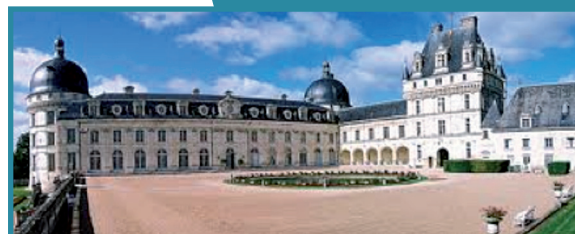
Château de Valençay

Notre proximité avec le bassin parisien, nos conditions d'accueil, nos lieux de prestige constituent de réels atouts pour accueillir la grande vitesse. Celle-ci permettrait de renforcer notre proximité avec le bassin parisien, permettant au département de devenir LE département touristique et culturel aux portes de Paris.