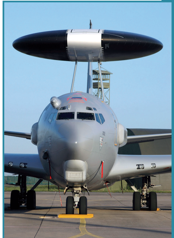
Boeing E3-F AWACS