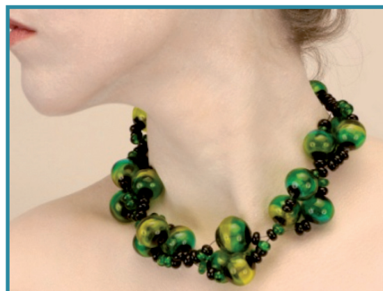
Lentilles d'eau : création de Valérie VAYRE - Bourges (verre filé)